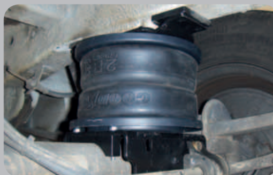
Kit de base 1550220100